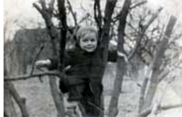
...hoch klettern musste er schon in frühen Jahren