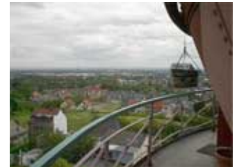
Der Fotografenkoffer hoch über den Dächern am Ziel angekommen