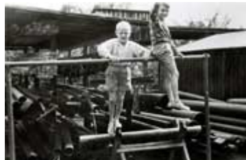
...mit dem Bruder "Bubi" auf dem Brunnenbauerhof