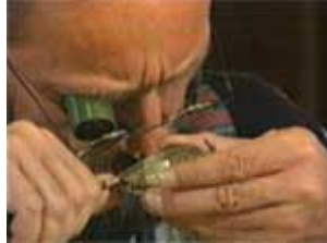
Mikrofeine Gravurarbeit an einem Schmuckstück