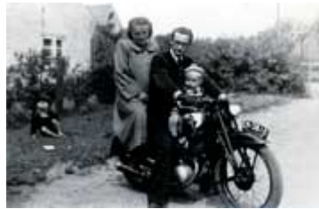
Mutter, Vater, erstes Kind 1953 in Ostpreußen

Galerien und Museen reißen sich um seine Präsenz. Viel Wirbel entsteht um den Mann, der aufgrund seiner Vielseitigkeit Anfang der siebziger Jahre als „Chao!“ gilt. „Damals war ein guter Künstler jener, der sich auf eine Stilrichtung spezialisierte, wie zum Beispiel Öker, der immer nur Nägel in Bretter klopfte, das jedoch meisterhaft“, erinnert sich Erdtmann. Ausstellen lassen will er sich nur als „ganzer Künstler“ - mit all seinen Talenten. Mit Skulpturen, Kollagen, Bildern in Öl und anderen Facetten. Für Ausstellungen nur mit Malerei oder nur mit Bildhauerei, wie es Kunstpápste verlangen, um ihn einzuordnen, ist er nicht zu haben – das ist dem Multitalent nicht genug.