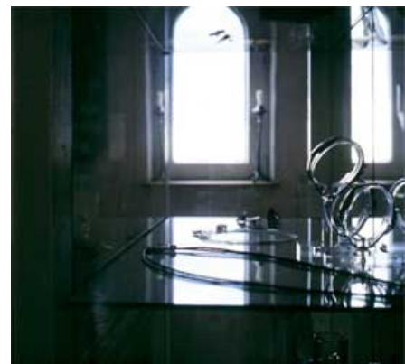
Schmuckvitrine im Turmfenster des Goldschmiedeateliers