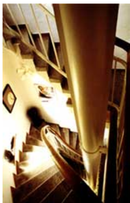
Der Weg nach oben (Treppenhaus im Turm)