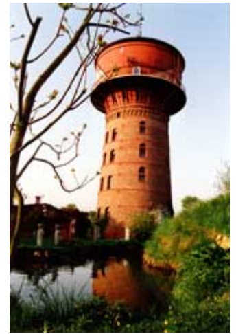
Das Atelier oben in der Stahlkugel