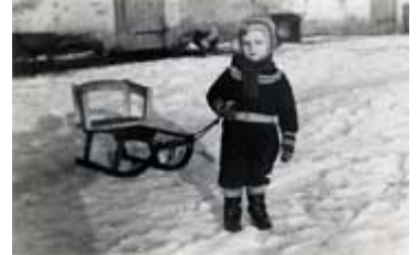
...im Masurischen Winter auf dem Bauernhof 1954